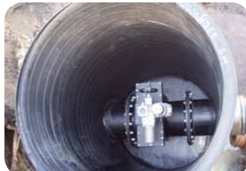
Ventilbrunn med styrdon