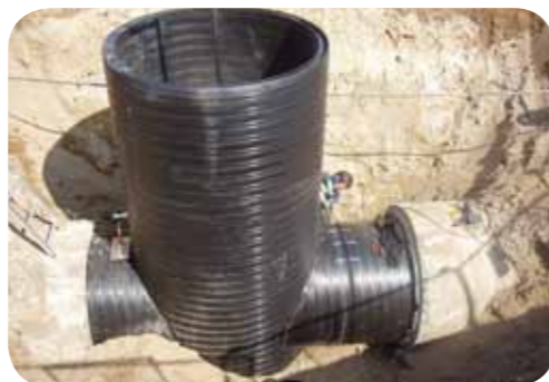
Katastrofavgängning för dagvatten