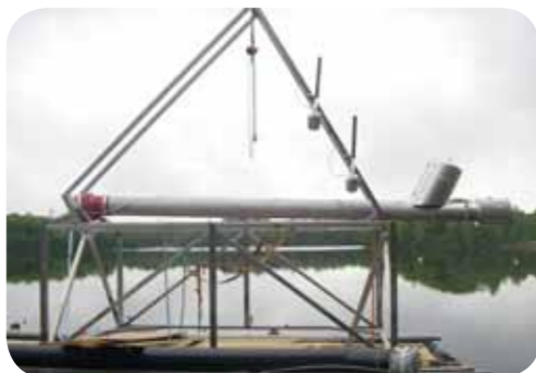
Intagsanordning för råvatten