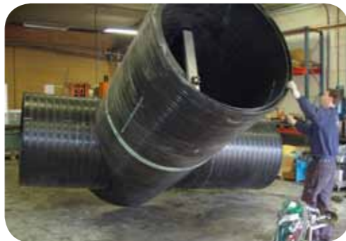
Brunn med slusslucka