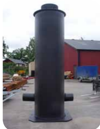
Ventilbrunn för lantbruk